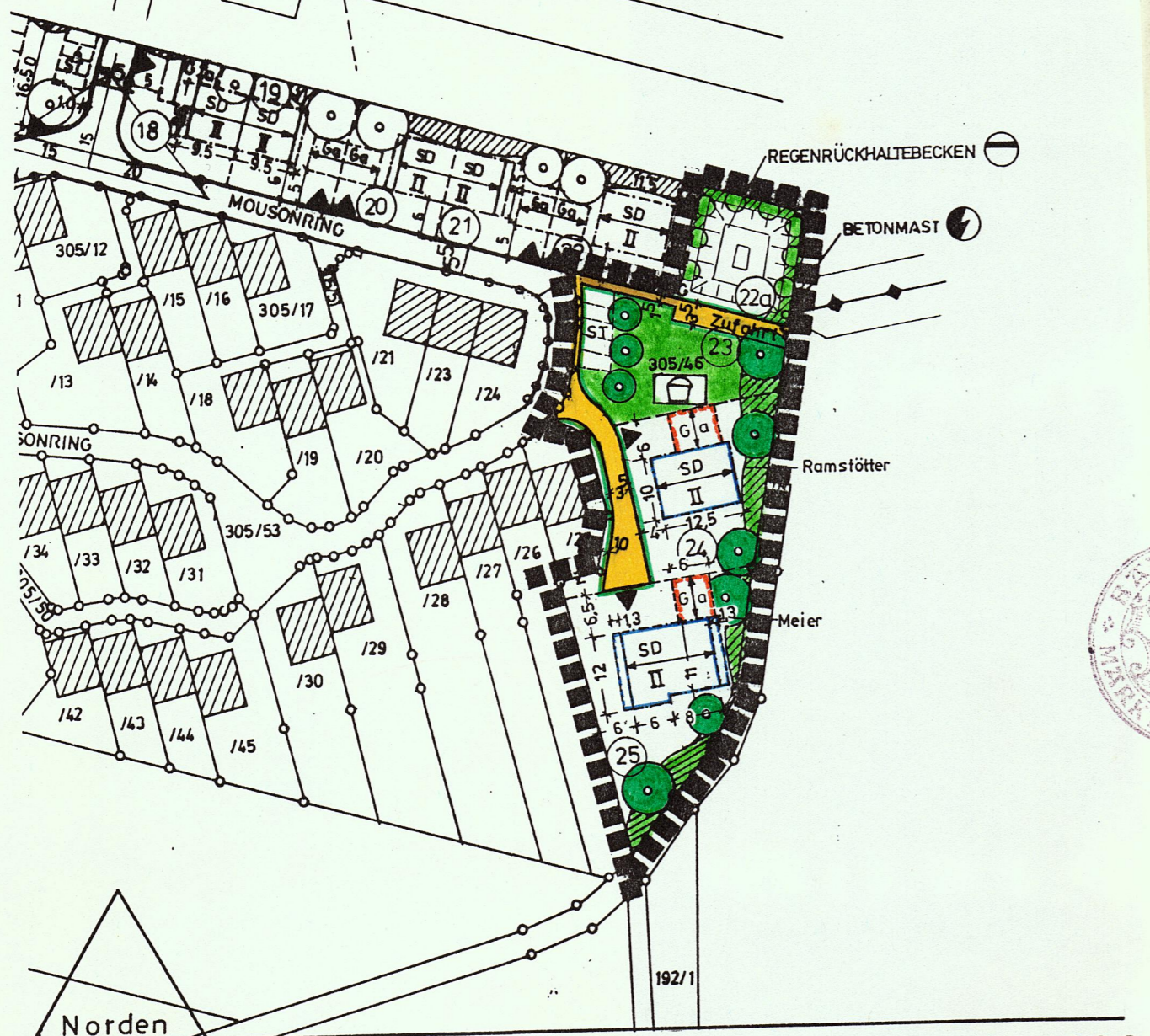
Lageplan M 1 : 1000

Der Planfertiger: Architektenbüro Hofmann + Döberlein Mittlere Feldstr.2,8228 Freilassing Tel. 08654/9028 03.03.1985 /RH