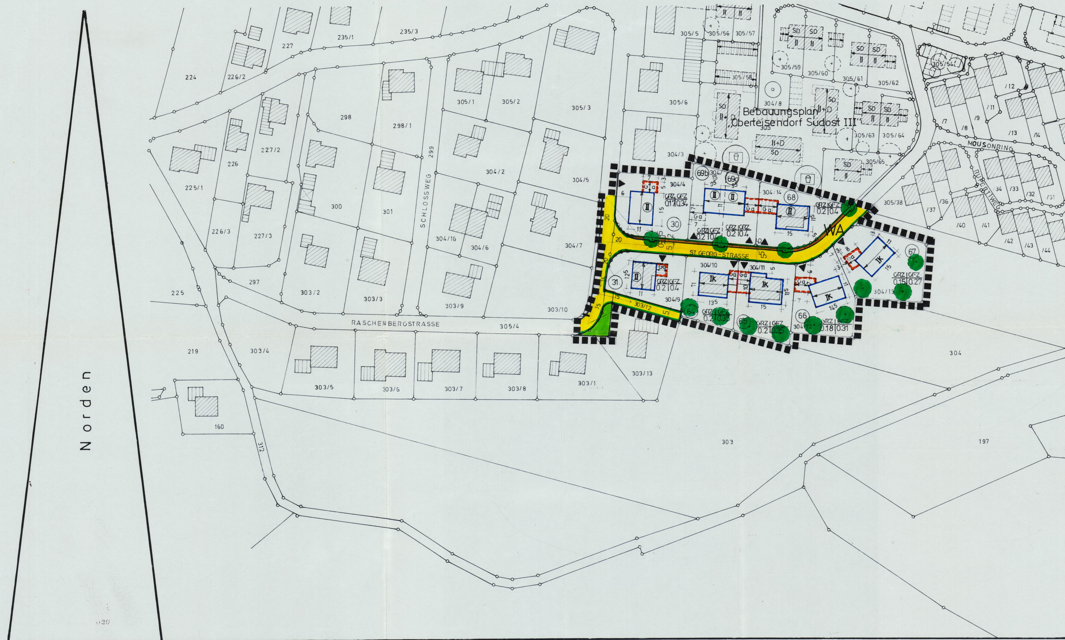
Lageplan im Maßstab 1 = 1000

Marktgemeinde Teisendorf Landkreis Berchtesgadener Land